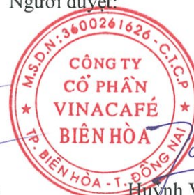
Huỳnh Việt Thăng Đại diện theo ủy quyền

Các thuyết minh đính kèm là bộ phận hợp thành của báo cáo tài chính hợp nhất này