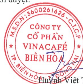
Huỳnh Việt Thăng Đại diện theo ủy quyền

Các thuyết minh đính kèm là bộ phận hợp thành của báo cáo tài chính hợp nhất này