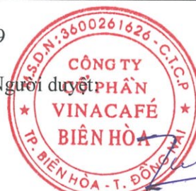
Huỳnh Việt Thăng Đại diện theo ủy quyền

Các thuyết minh đính kèm là bộ phận hợp thành của báo cáo tài chính hợp nhất này